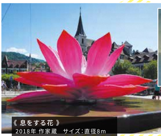
《息をする花》 2018年 作家蔵 サイズ:直径8m

チェ・ジョンファ Choi Jeong Hwa 韓国・ソウル在住。身近な素材を用いて、強烈な色使いとダイナミックな造形で、非日常的な彫刻作品を制作する国際的に活躍する現代美術家。