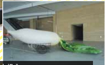
《大根》 2019年 作家蔵 サイズ:直径8m