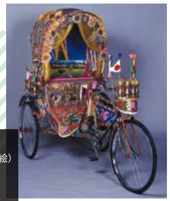
《リキシャ》 サイド・アハメッド・ホセイン(絵) アリ・メカール(車体製作) 1994年 福岡アジア美術館所蔵

今もバングラデシュの首都ダッカで、庶民の足として利用されるリキシャは華やかな装飾が特徴です。